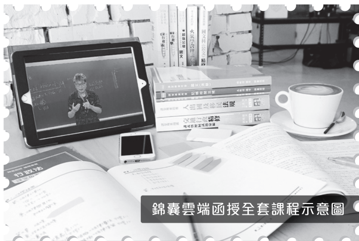
錦囊雲端函授全套課程示意圖